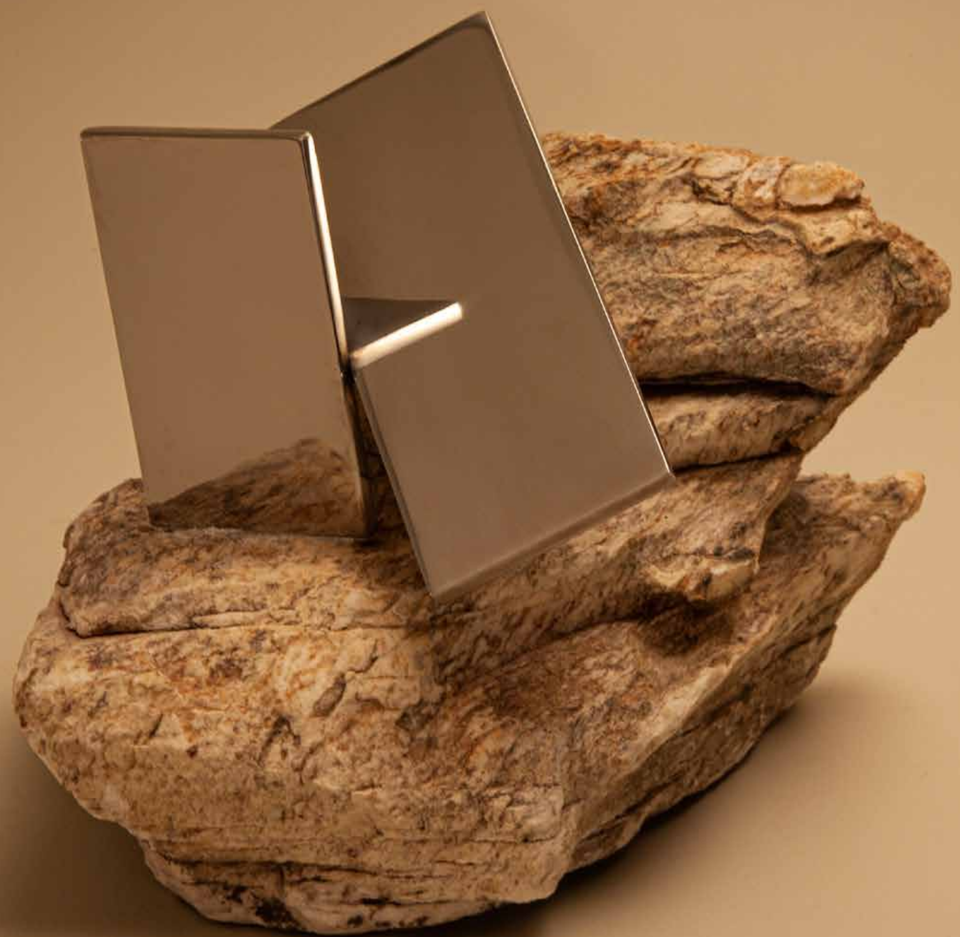
Espacial , 2022 • Pedra com aço inox incrustado • 18 x 22 x 19,5 cm