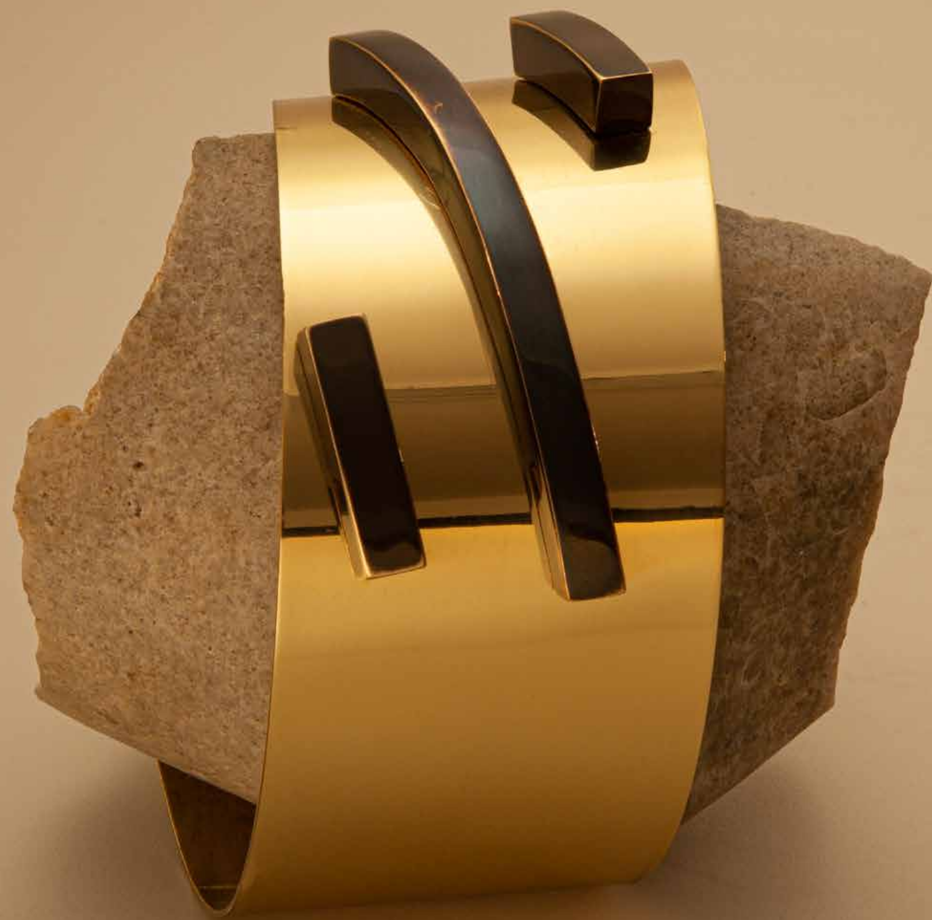
Envolvendo III, 2022

Pedra com latão polido e detalhe patinado • 11 x 15,5 x 13 cm