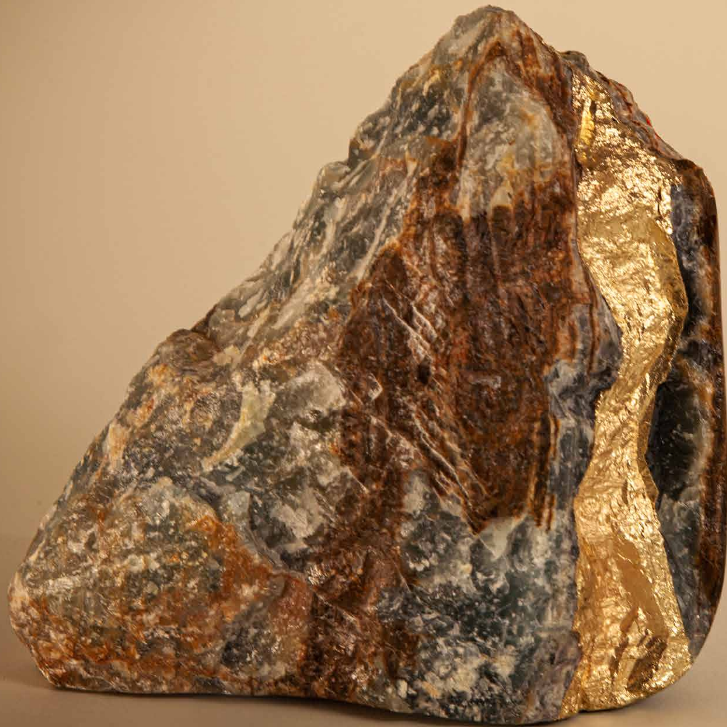
Entranhas, 2022 • Pedra com detalhe em banho de latão • 18 x 17,5 x 16 cm