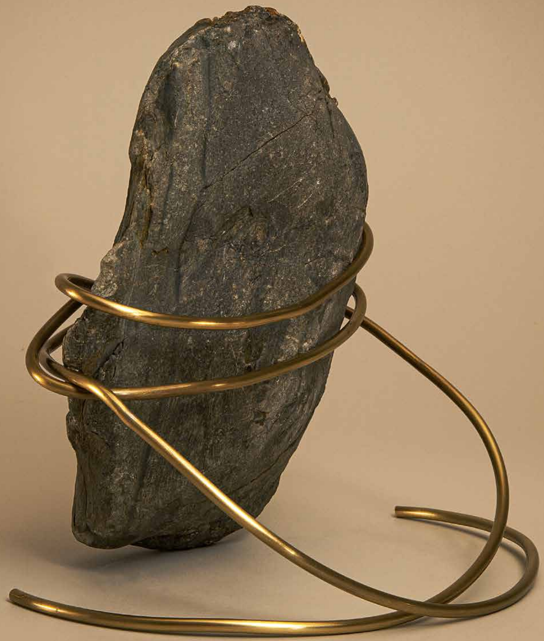
Atame , 2022 • Pedra com fio de latão • 21 x 21 x 17 cm