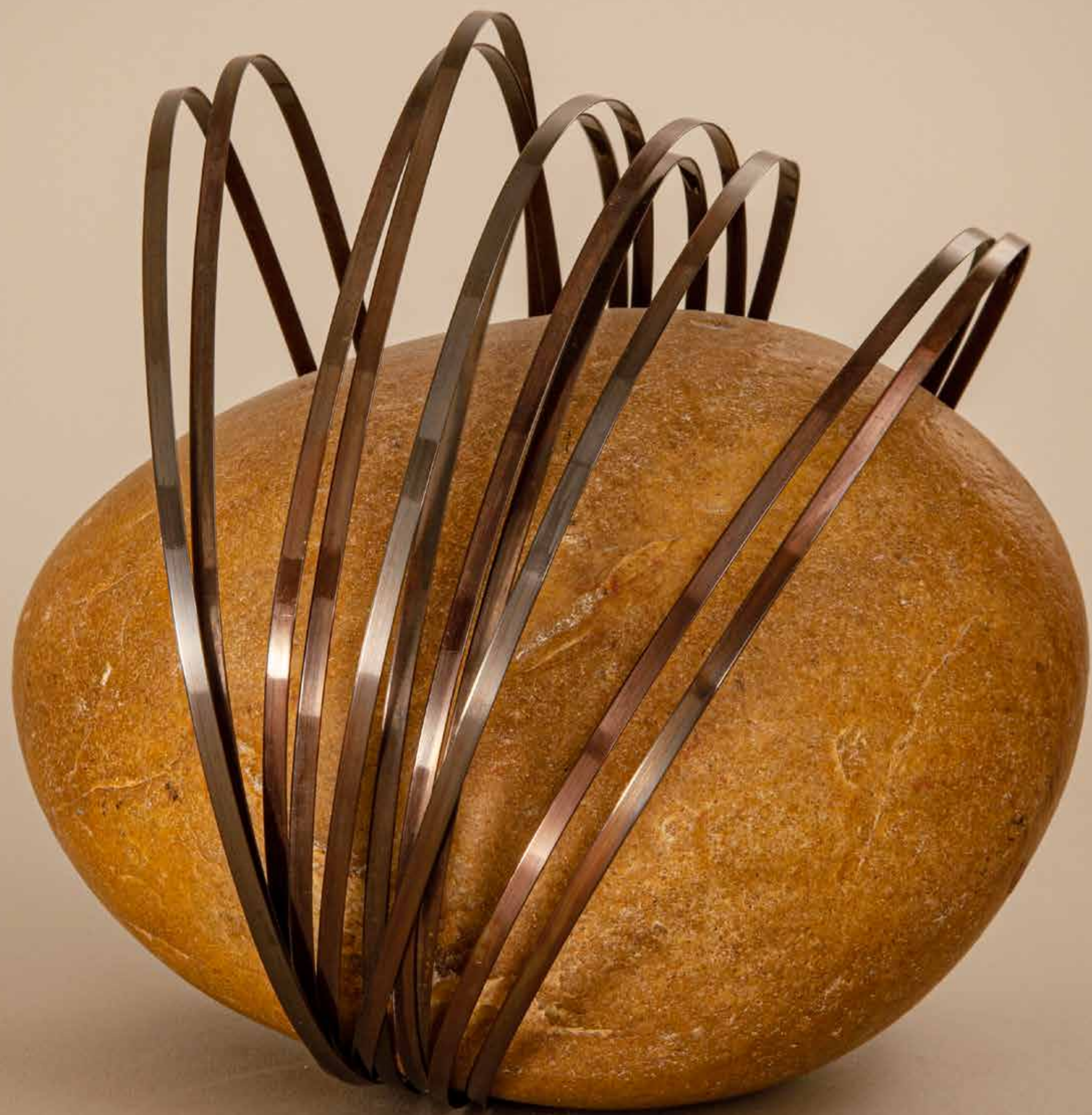
Carinho I , 2022 • Pedra com fita de latão patinado • 18 x 20 x 19,5 cm