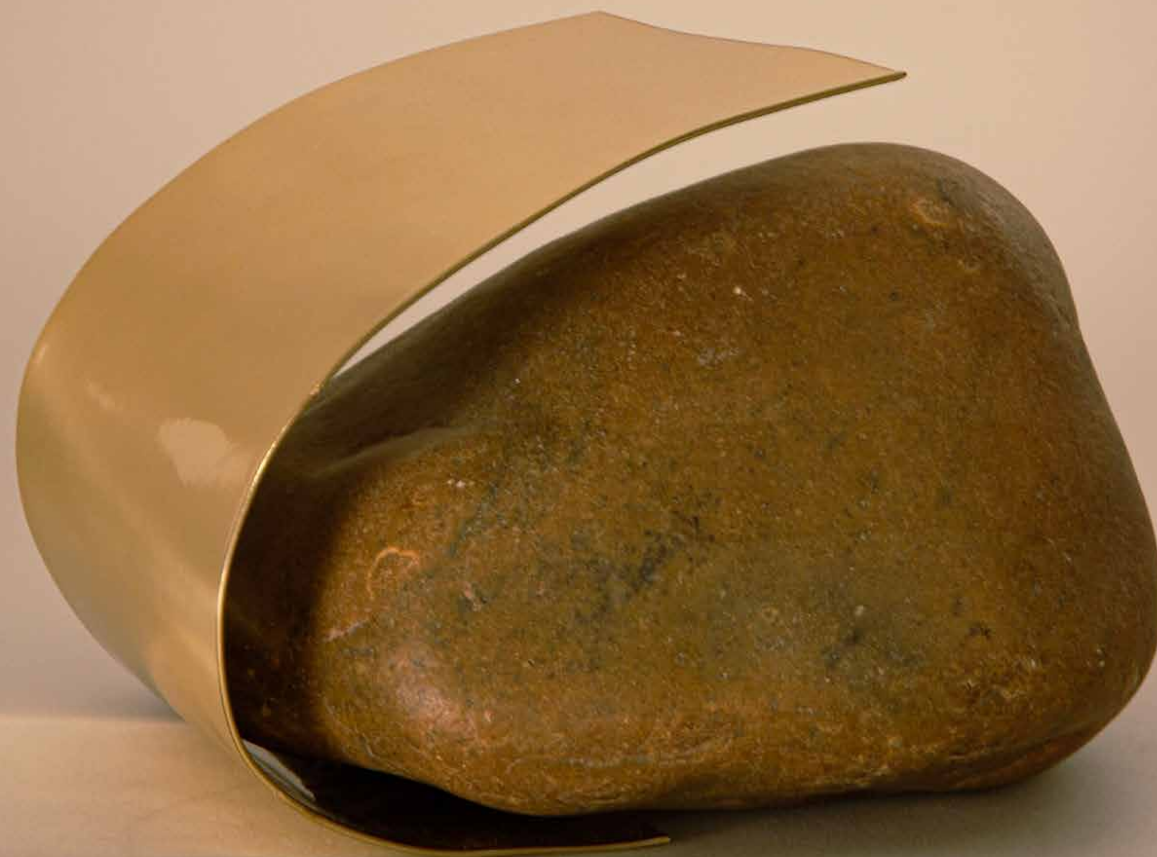
Fantasia , 2022 • Pedra com fita de latão polido • 11 x 15 x 16 cm