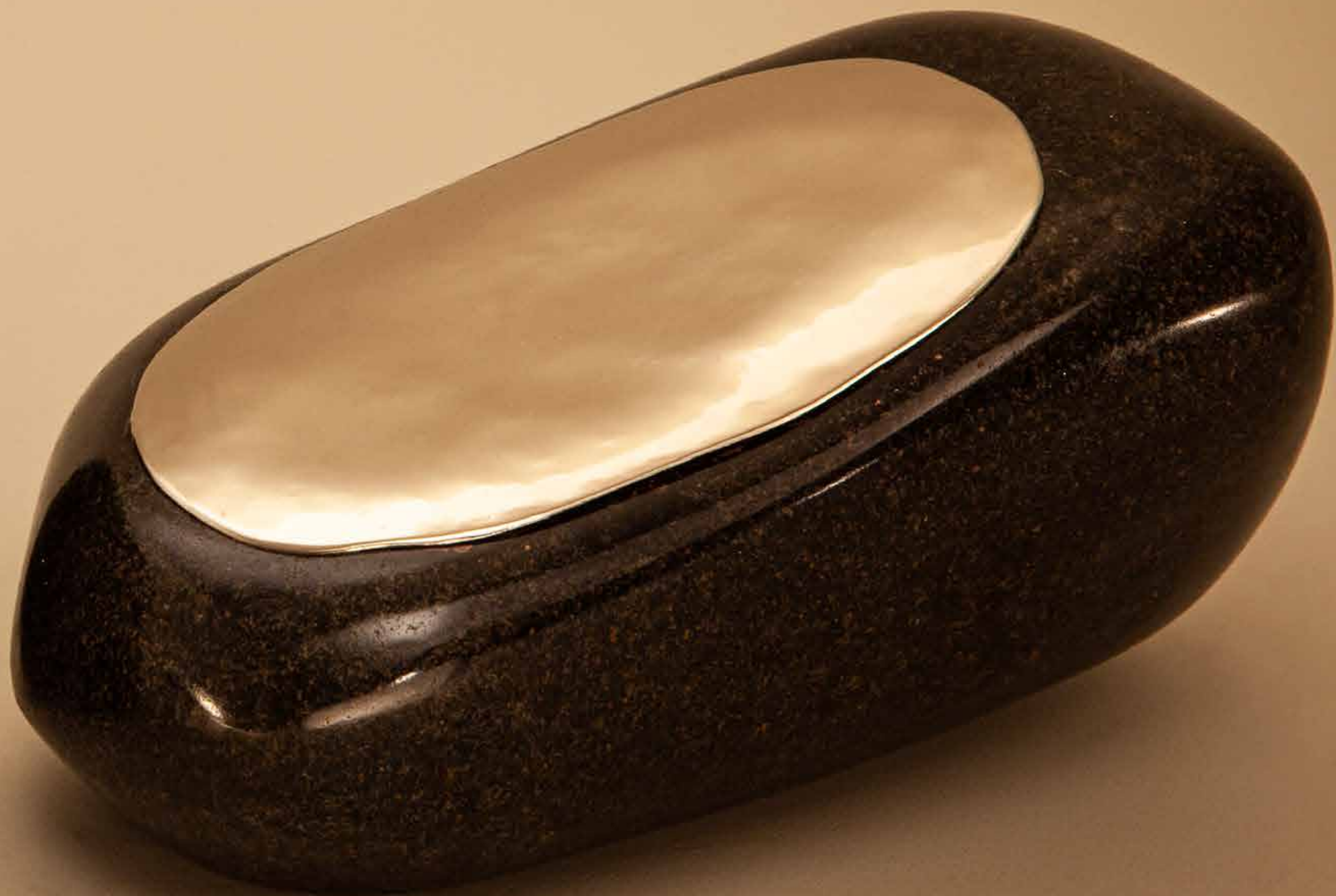
Um brilho , 2022 • Pedra polida com banho de níquel • 8,5 x 14 x 12,5 cm