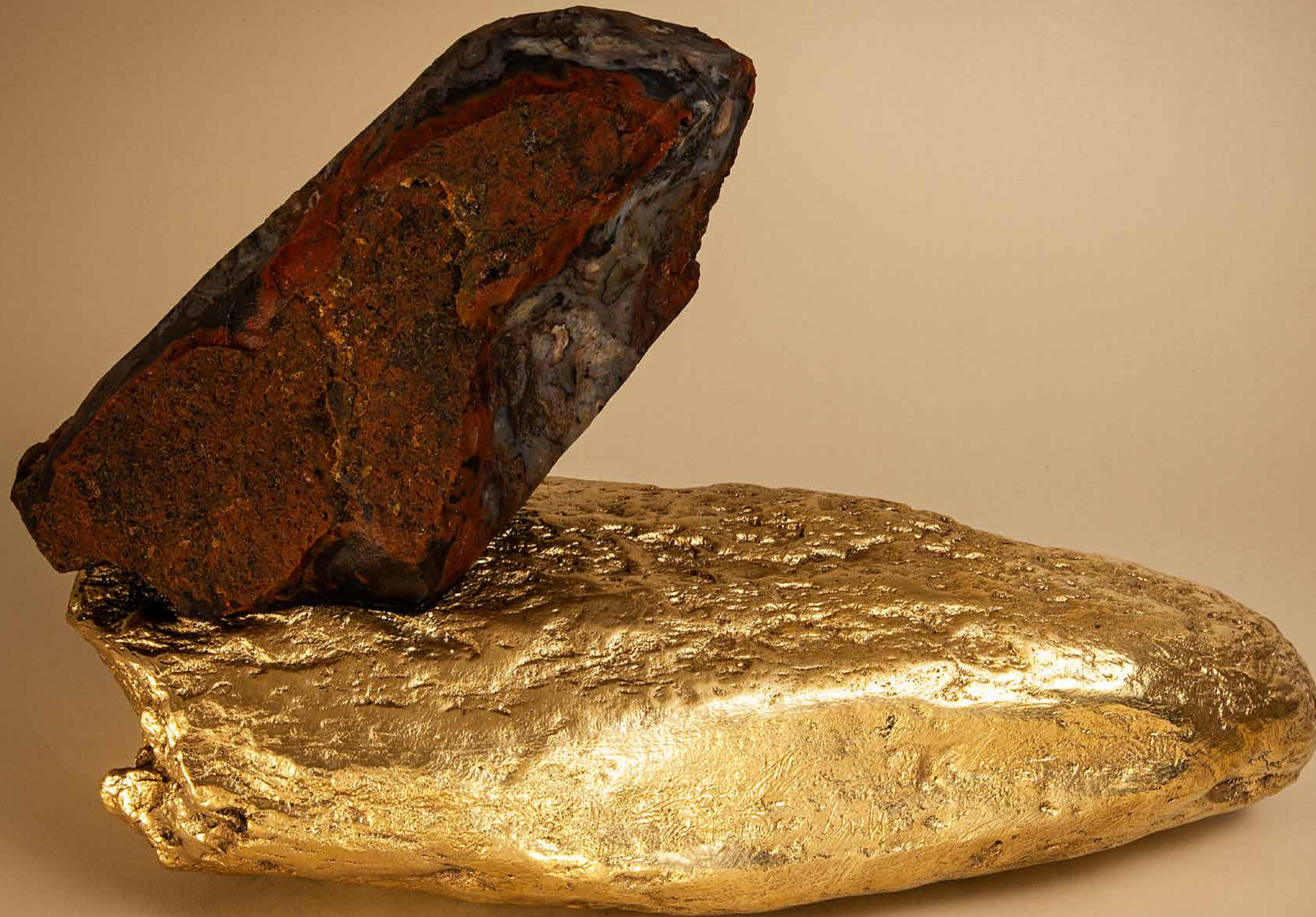
Enigma , 2022 • Pedra rústica sobre pedra com banho de latão • 24,5 x 37 x 20 cm