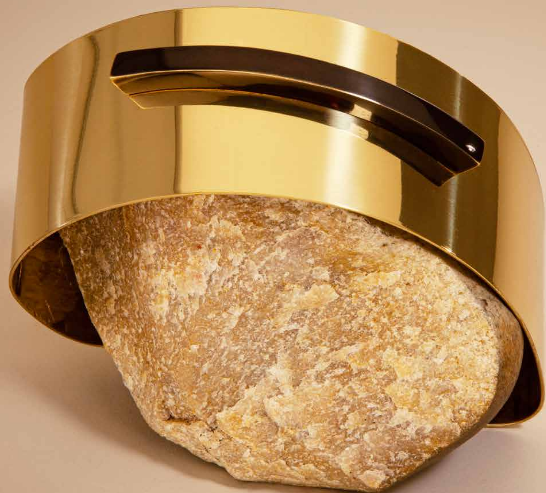
Envolvendo I, 2022

Pedra com latão polido e detalhe patinado • 12 x 17 x 15 cm