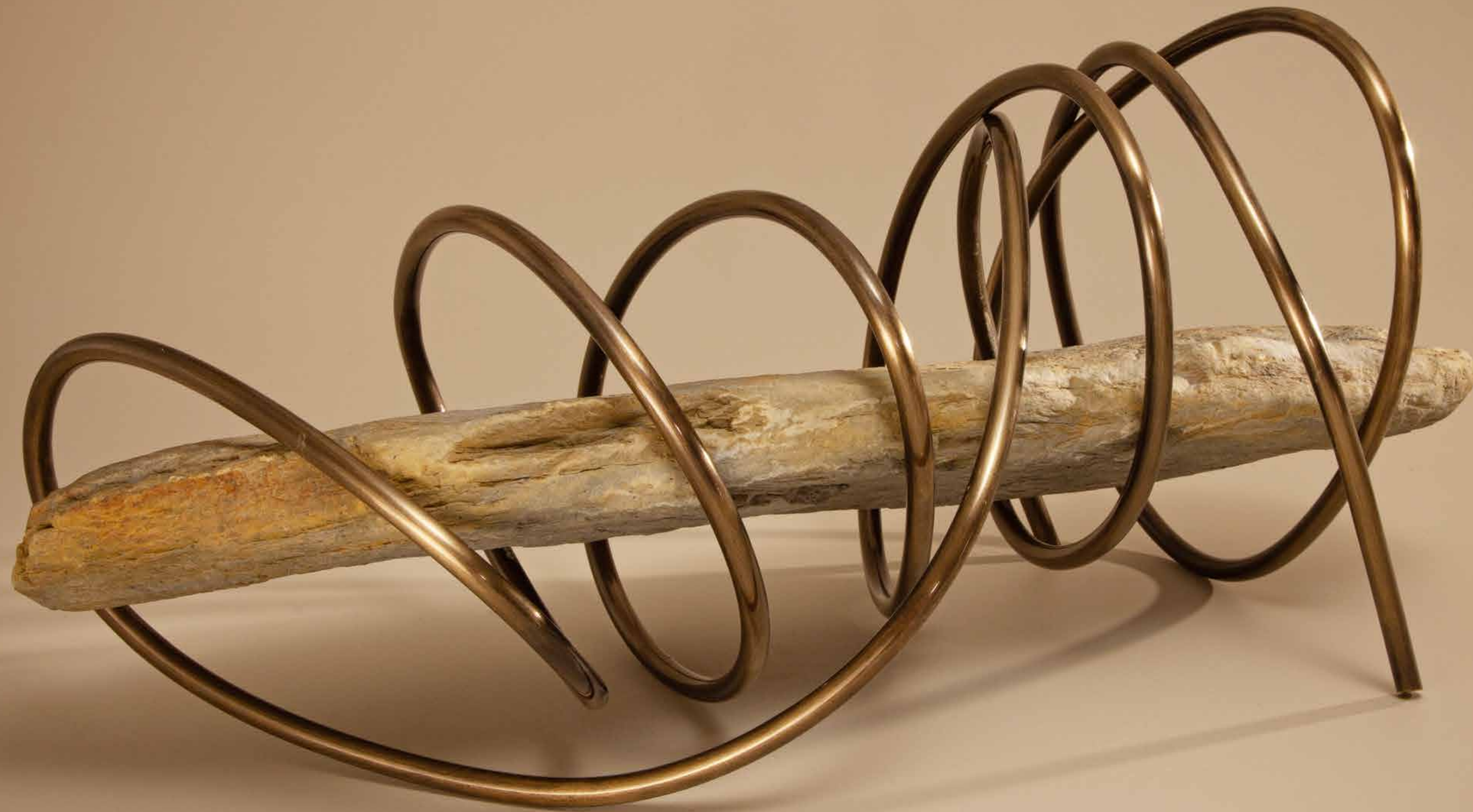
Amparo , 2022 • Pedra com fio de latão patinado • 22,5 x 50 x 27 cm