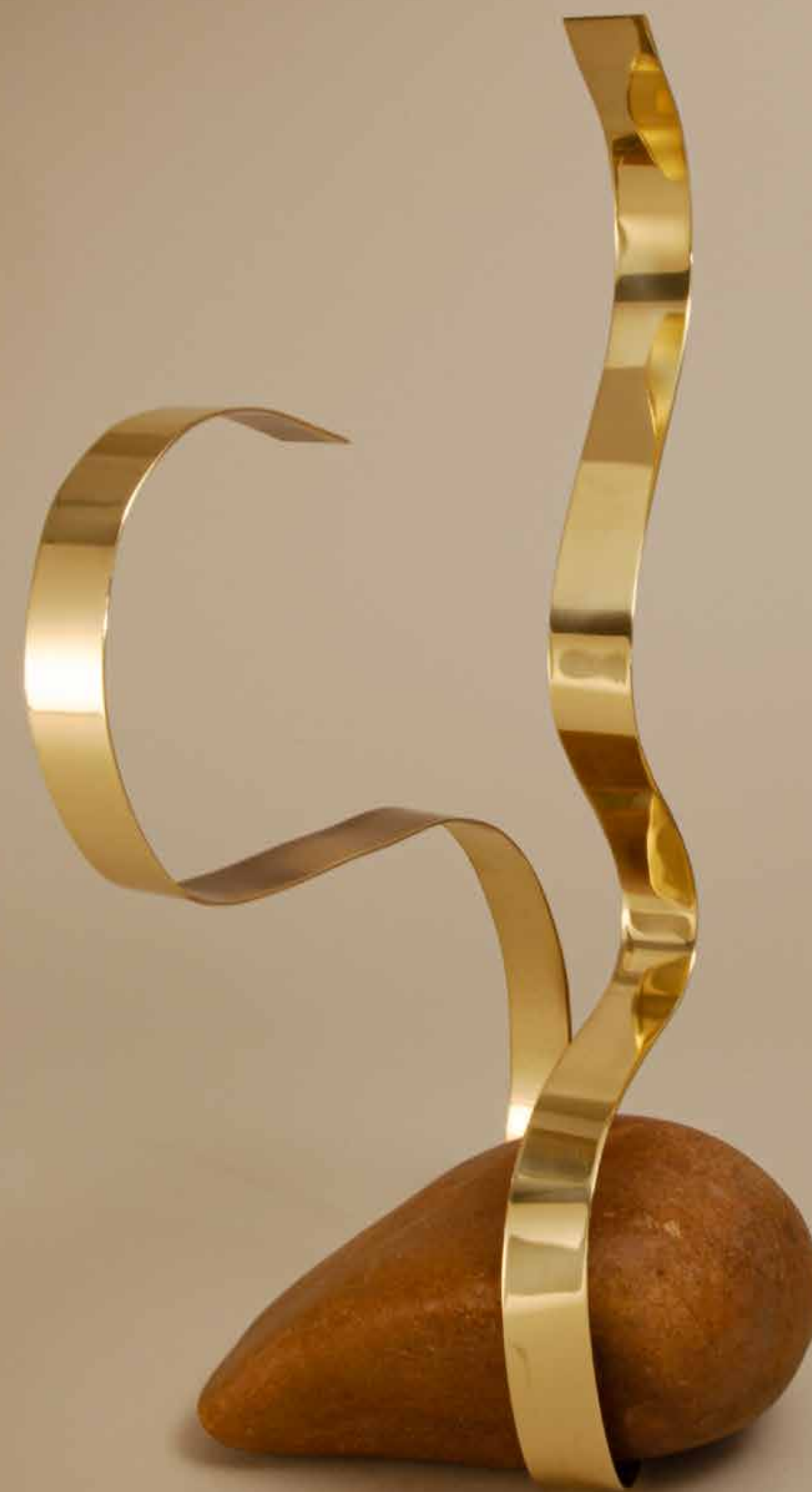
Ascensão , 2022 • Pedra polida com latão patinado • 35 x 18 x 16,5 cm