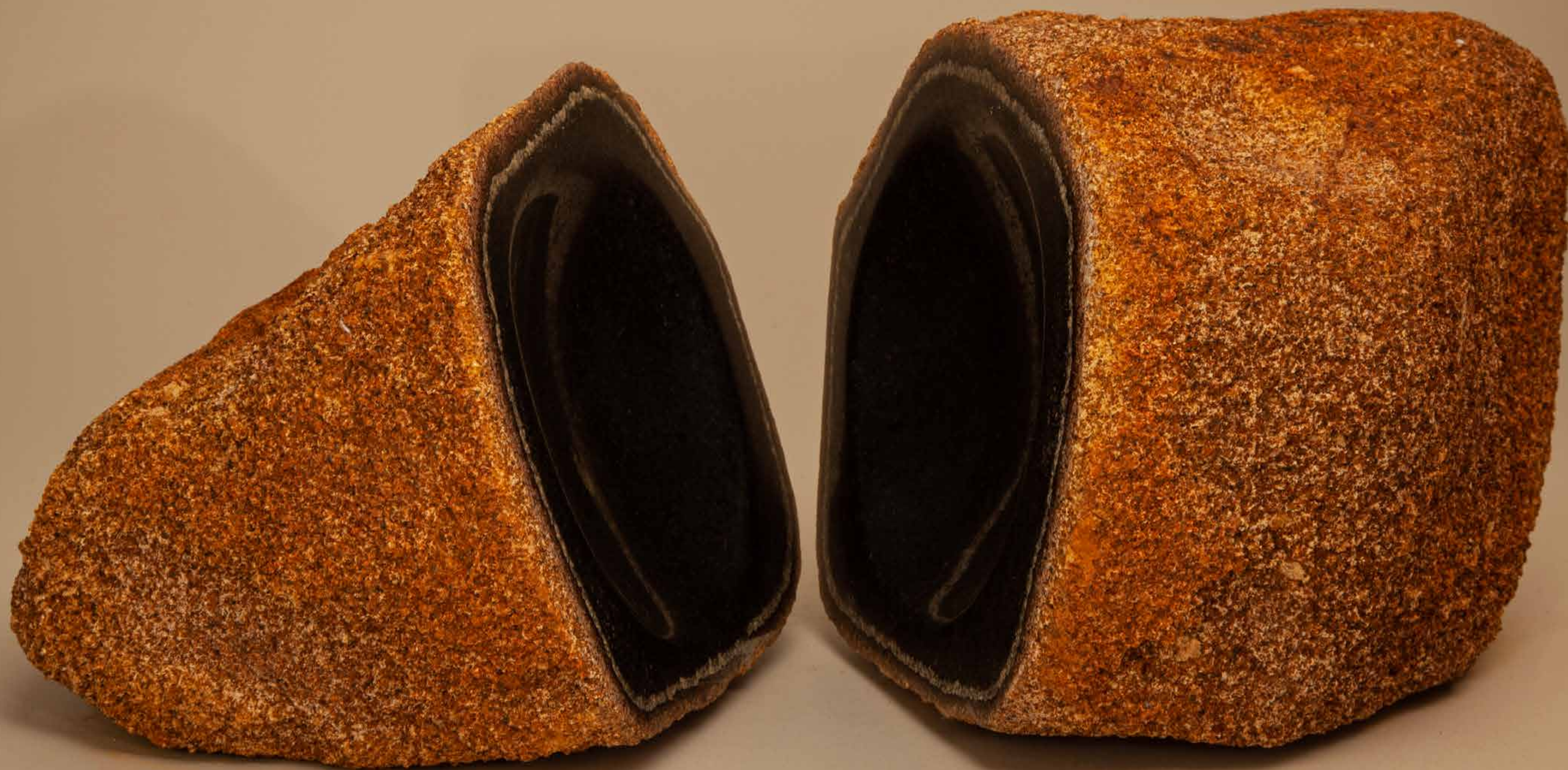
Beleza interior , 2022 • Pedra rústica com detalhe polido • 12,5 x 15 x 16 cm | 13,5 x 13,3 x 19 cm