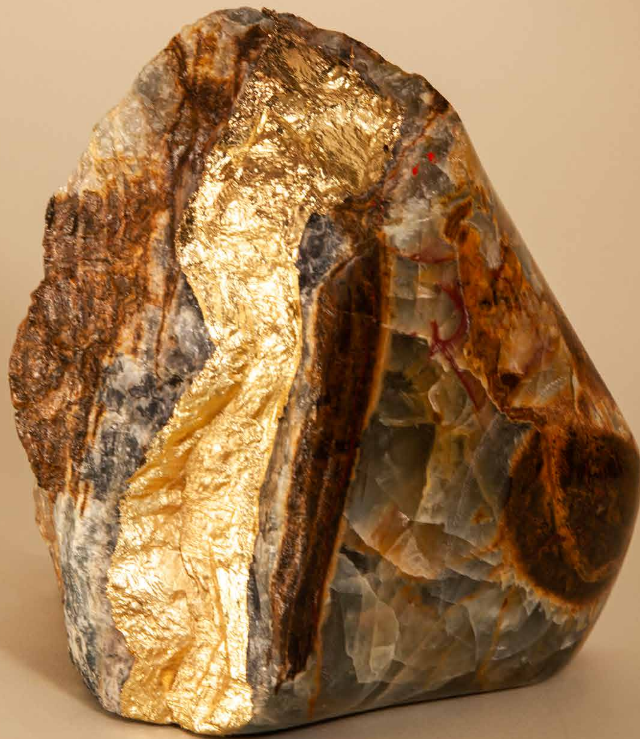
Entranhas, 2022 • Pedra com detalhe em banho de latão • 18 x 17,5 x 16 cm