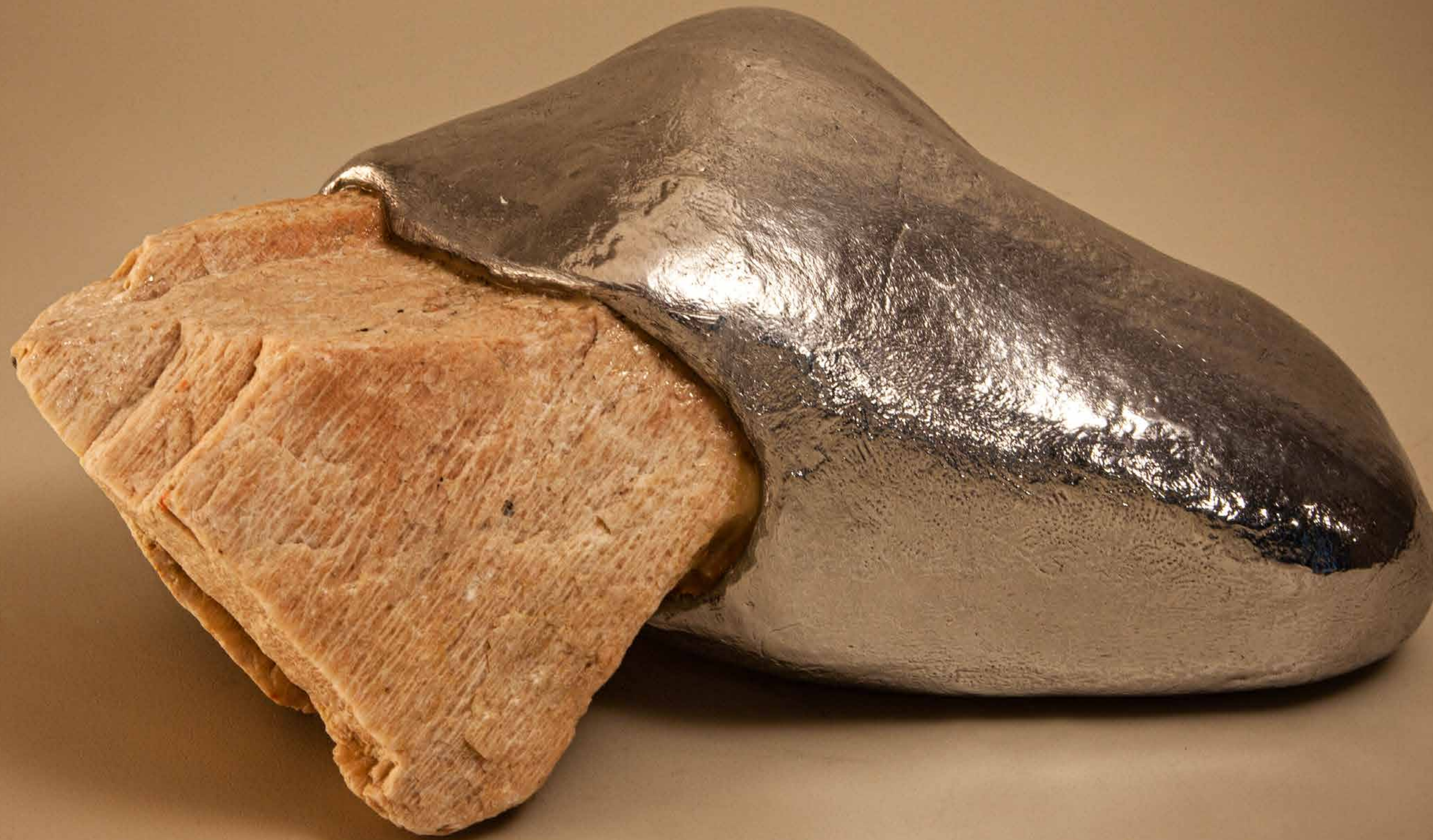
Desabafo , 2022 • Pedra rústica com banho de alumínio • 11,5 x 25,8 x 18,5 cm