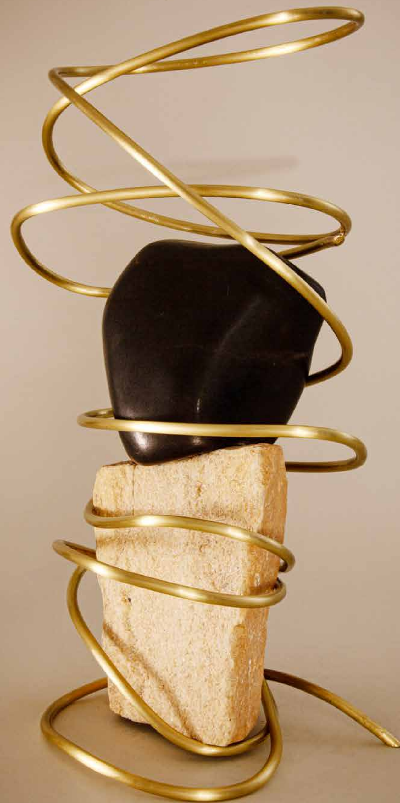
Magia , 2022 Pedra polida e pedra rústica com fio de latão polido • 39 x 22 x 16 cm