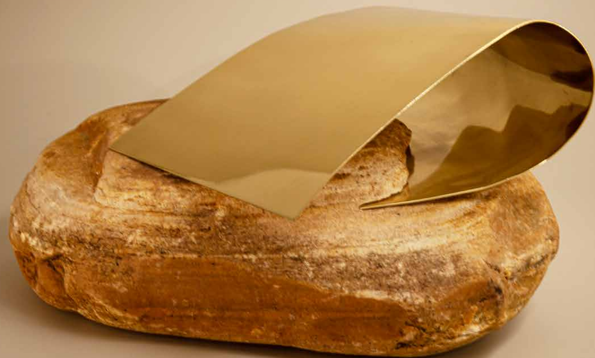
Aquecimento , 2022 • Pedra com fita de latão polido • 19 x 30 x 33 cm