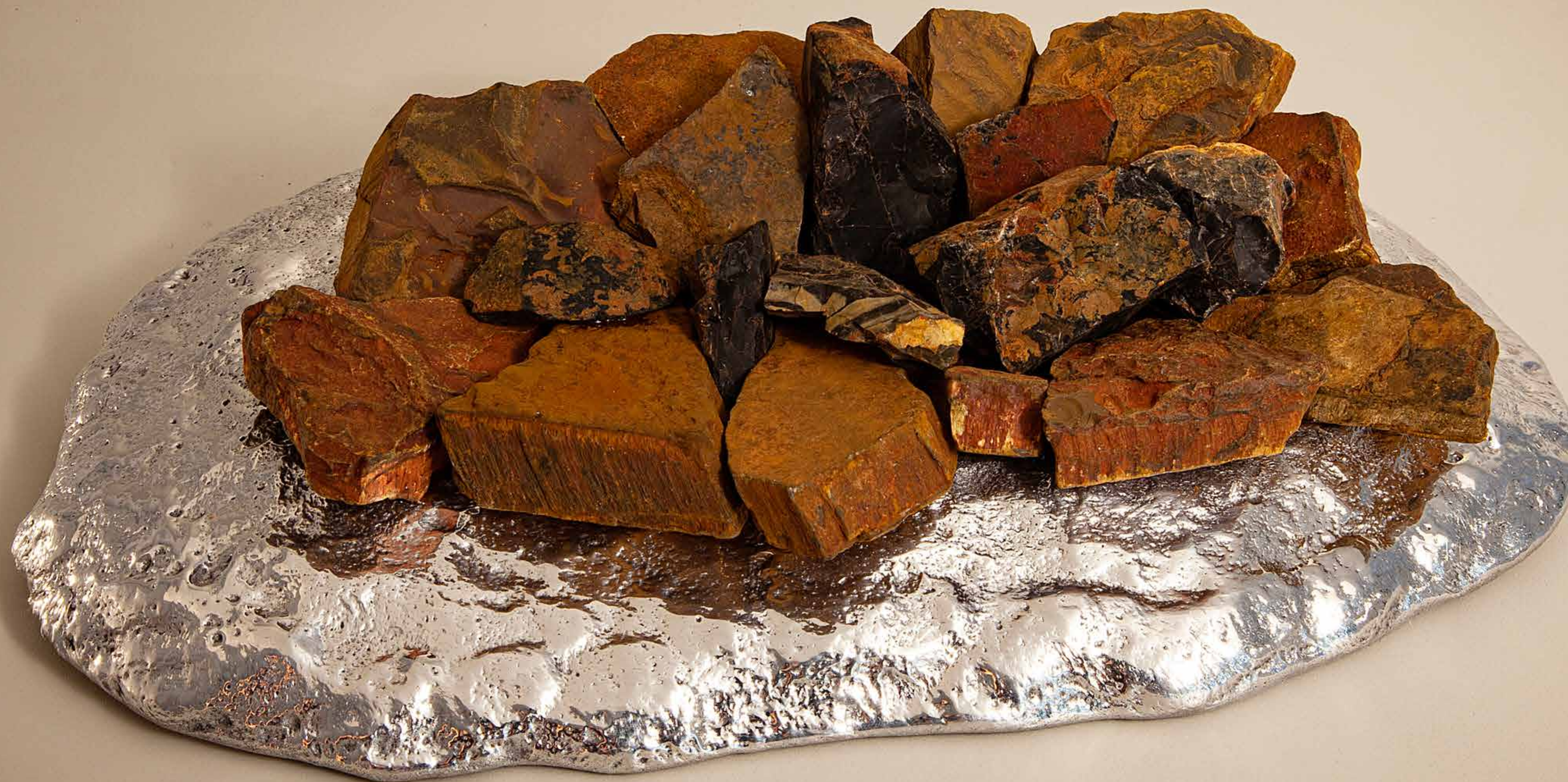
Amasso, 2022 • Conjunto de pedras sobre pedra com banho de alumínio • 7,5 x 29 x 21,5 cm