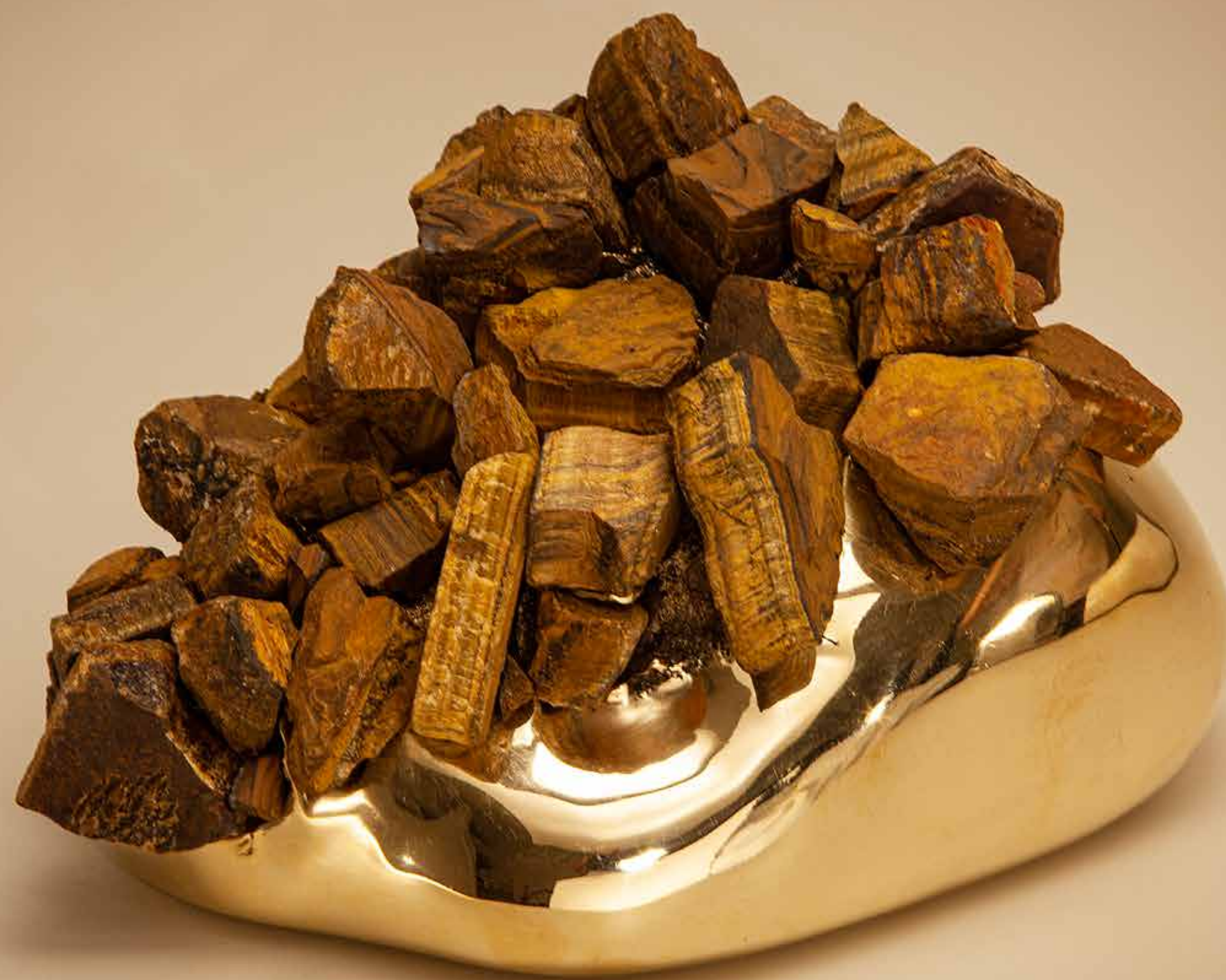
Projeção , 2022 • Conjunto de pedras aplicadas sobre latão • 15 x 25 x 21 cm