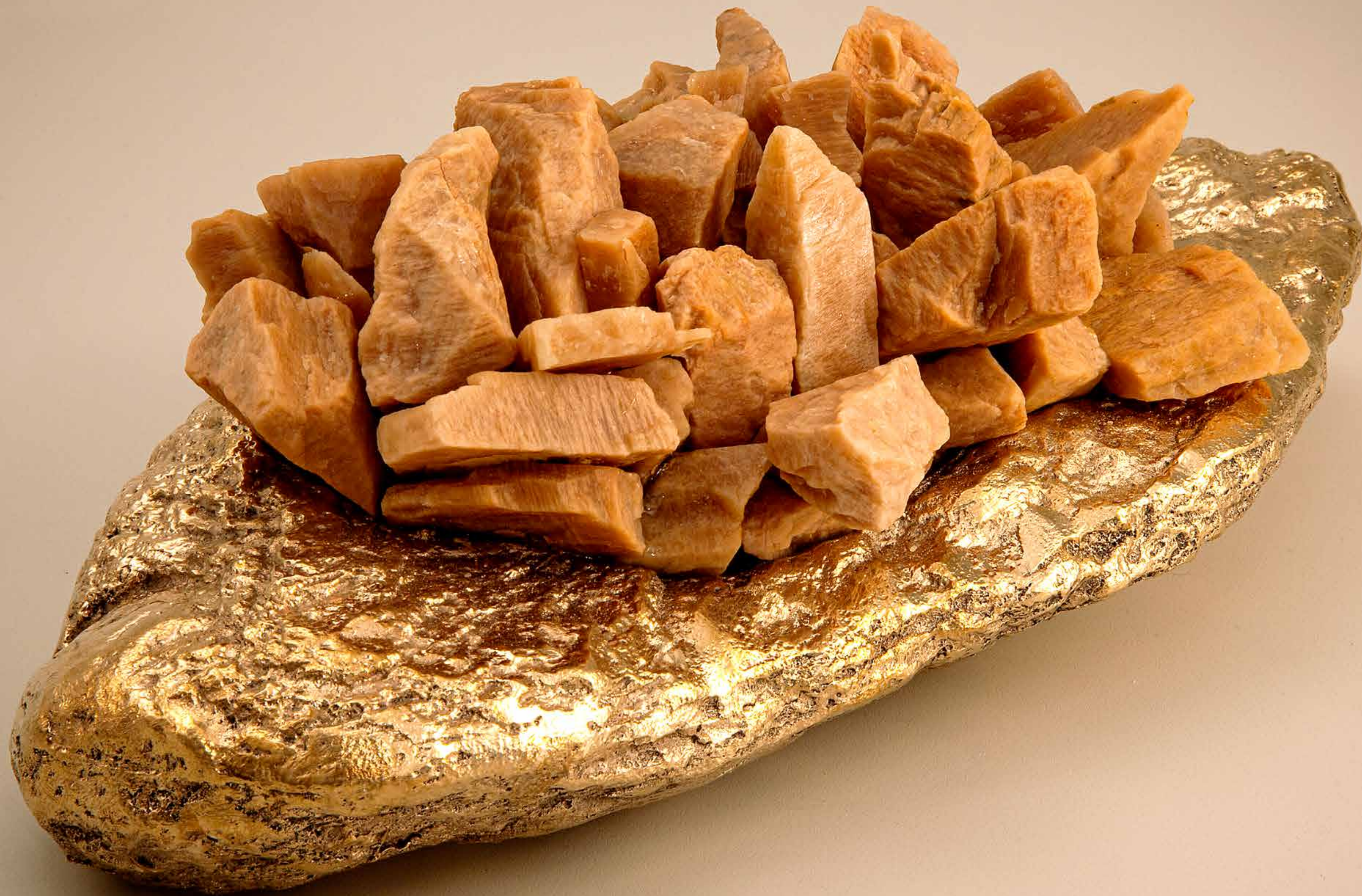
Abrigo , 2022 • Conjunto de pedras aplicadas em pedra rústica com banho de bronze • 12 x 30,5 x 18 cm