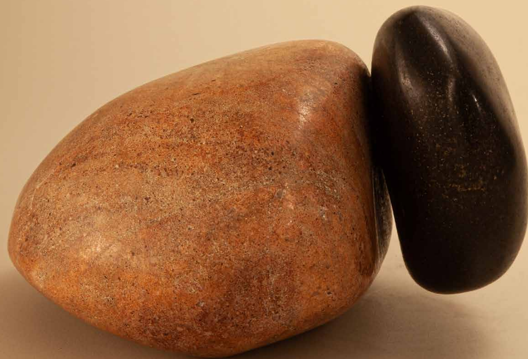
Vínculo , 2022 • Pedras polidas • 12,5 x 19,5 x 18 cm