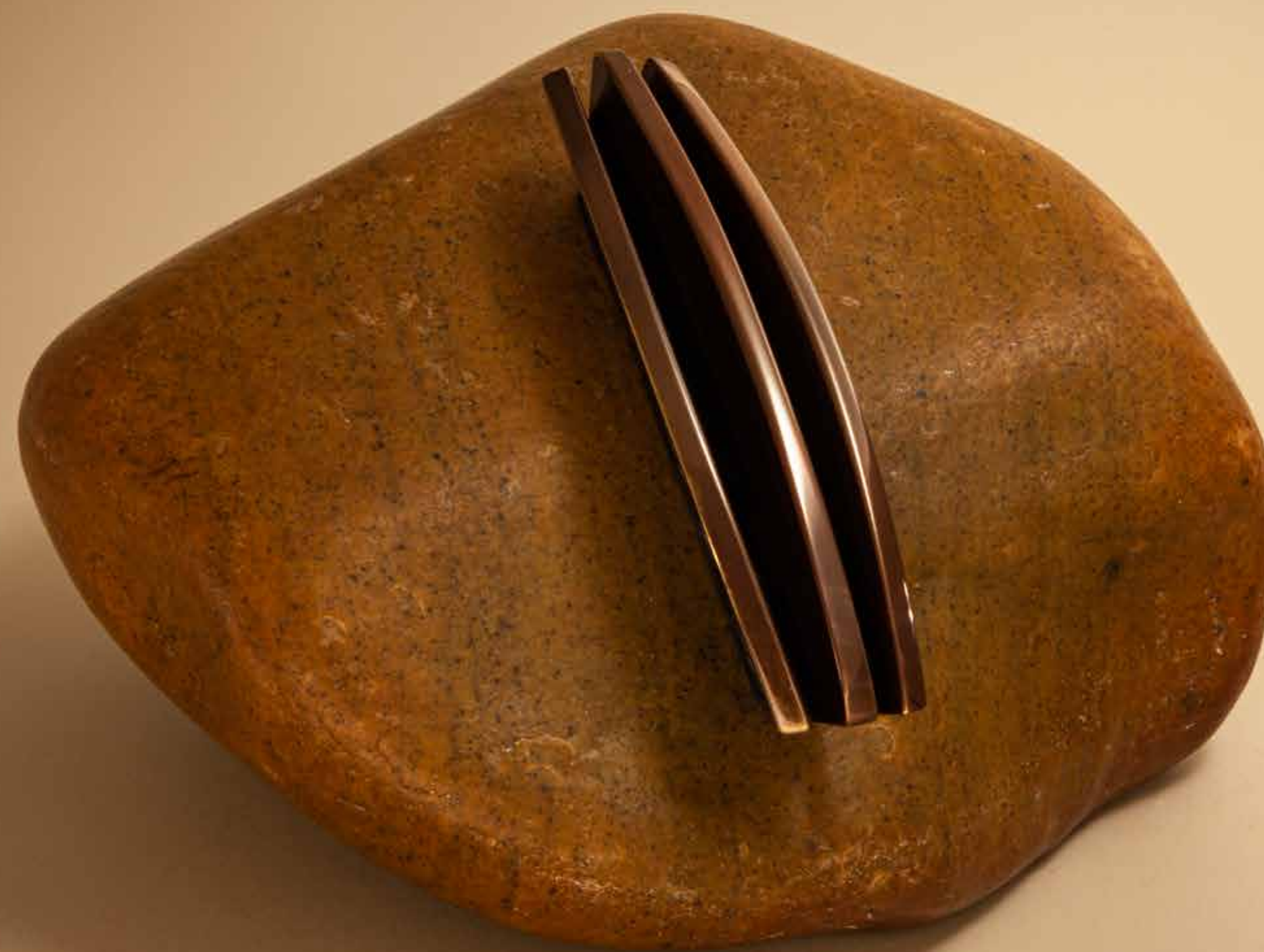
Saliência , 2022 • Pedra com latão patinado incrustado • 16 x 22,5 x 22,5 cm