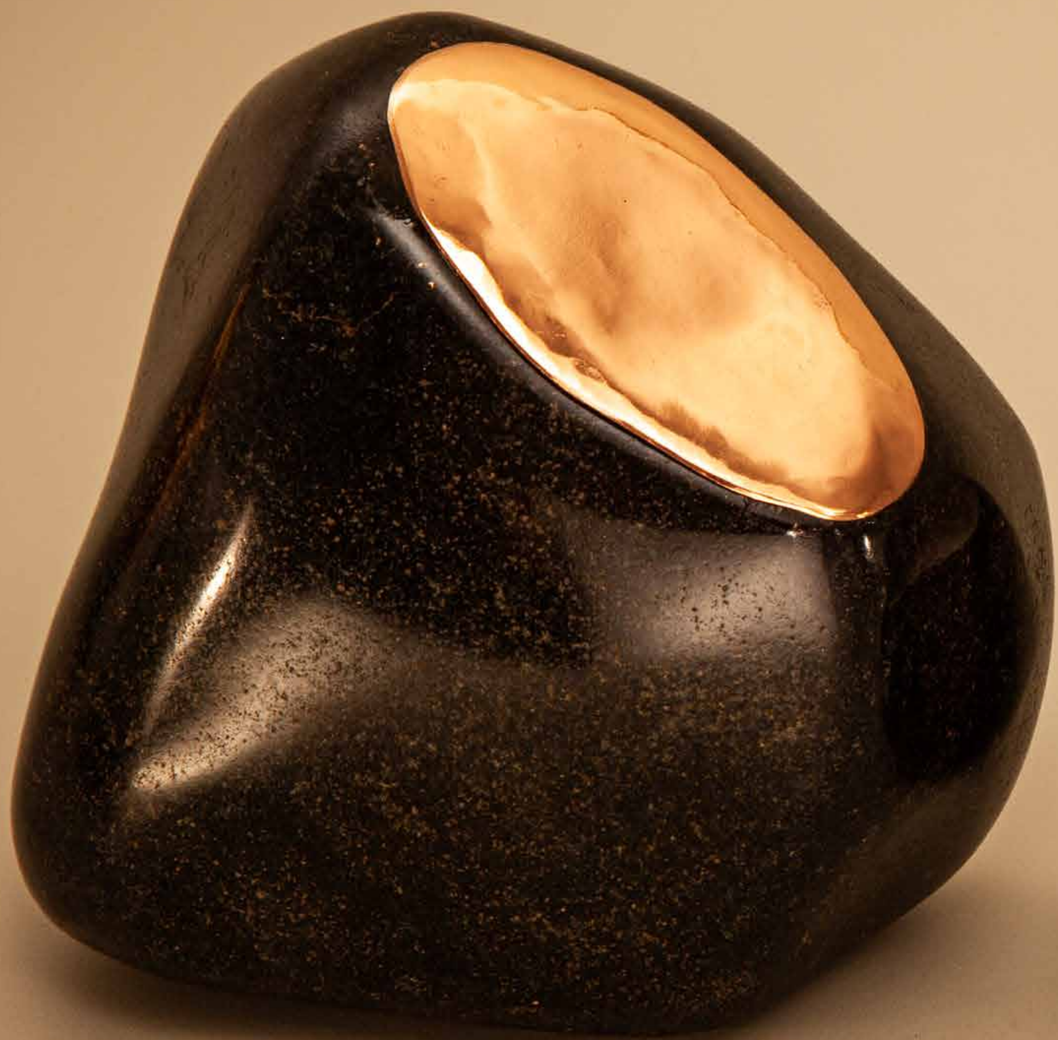
Um olhar , 2022 • Pedra polida com banho de cobre • 13 x 9 x 12,5 cm