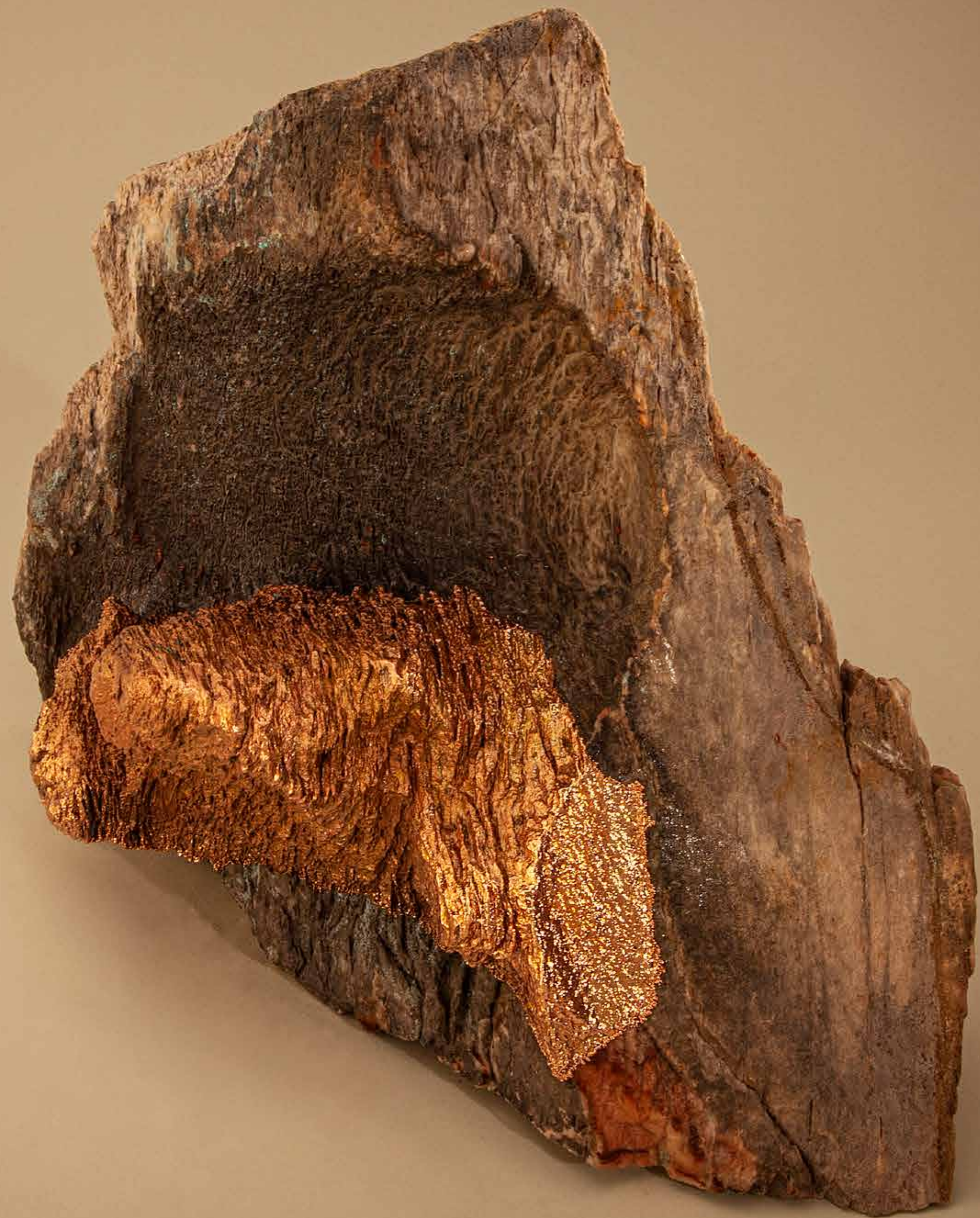
Ermita , 2022 • Pedra com detalhe em banho de cobre • 28 x 29,5 x 15 cm