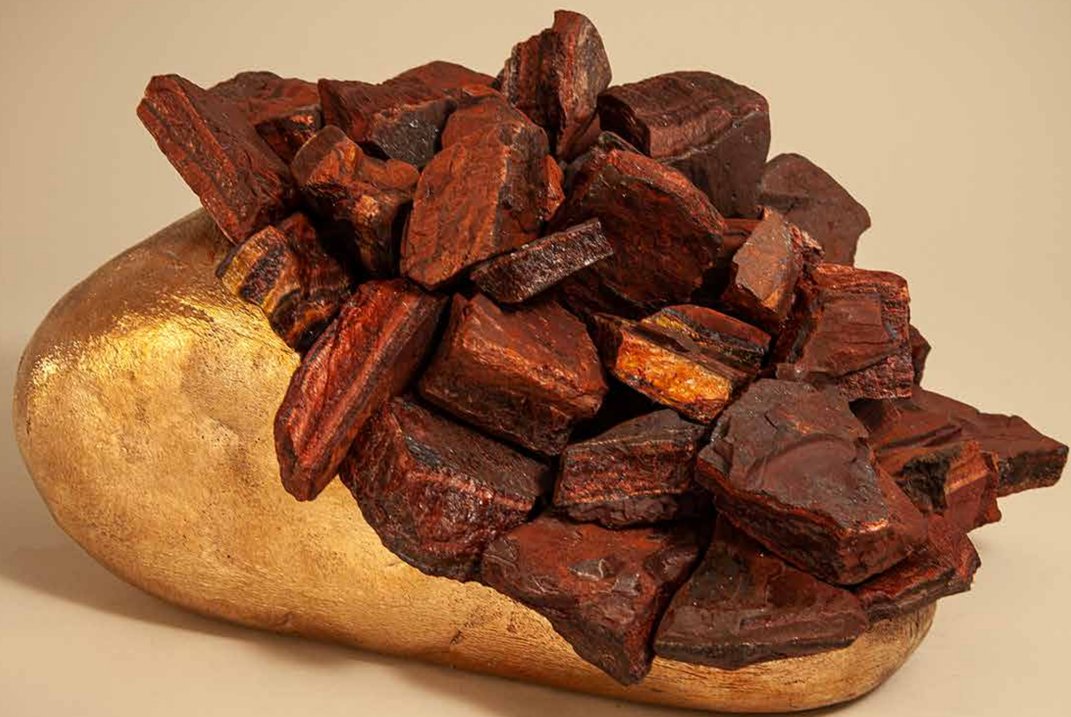
Calor , 2022 • Conjunto de pedras sobre pedra com banho de bronze • 13 x 25 x 21 cm