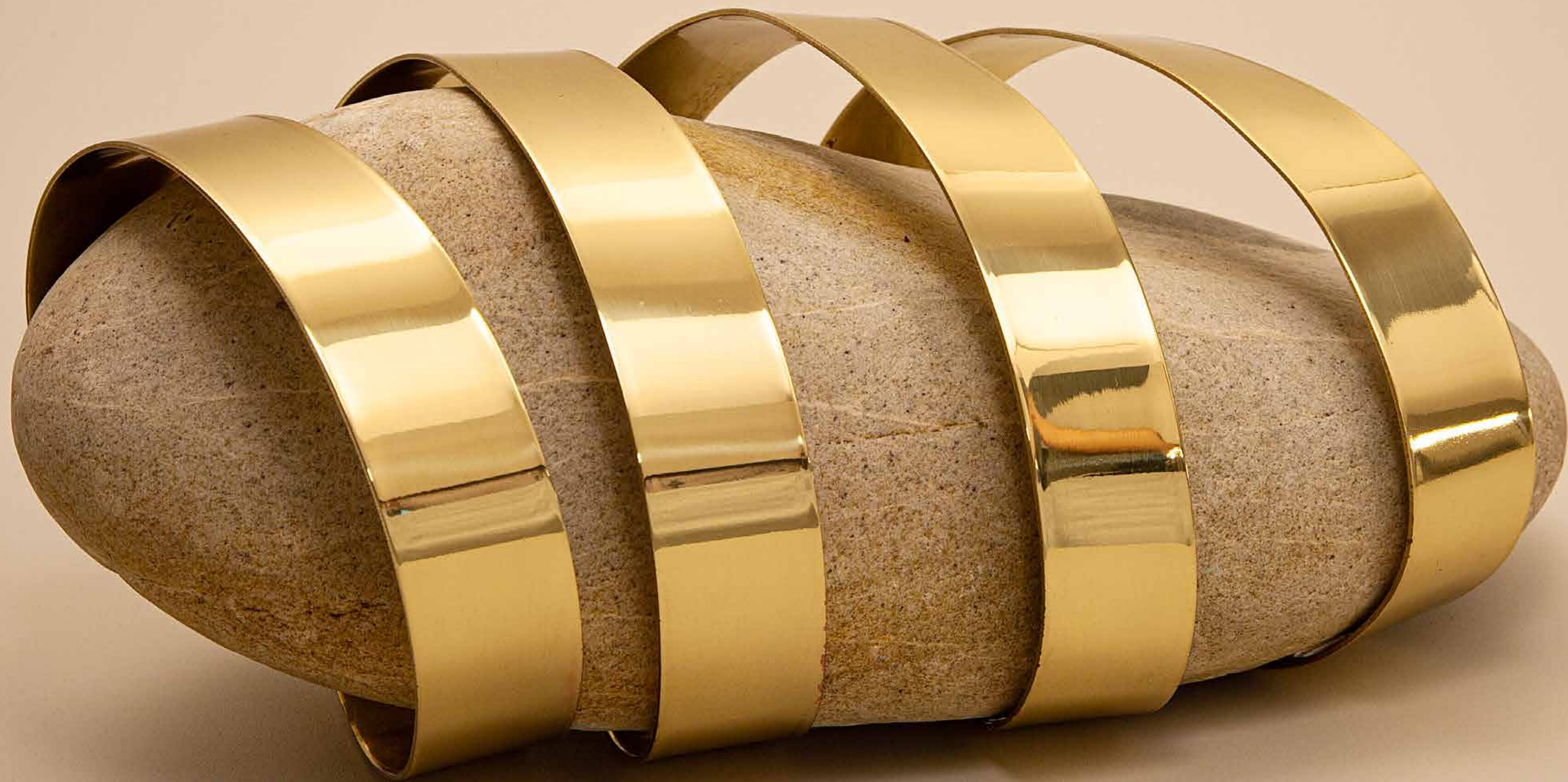
Cativa, 2022 • Pedra com fita de latão polido • 13,5 x 28,3 x 19,2 cm