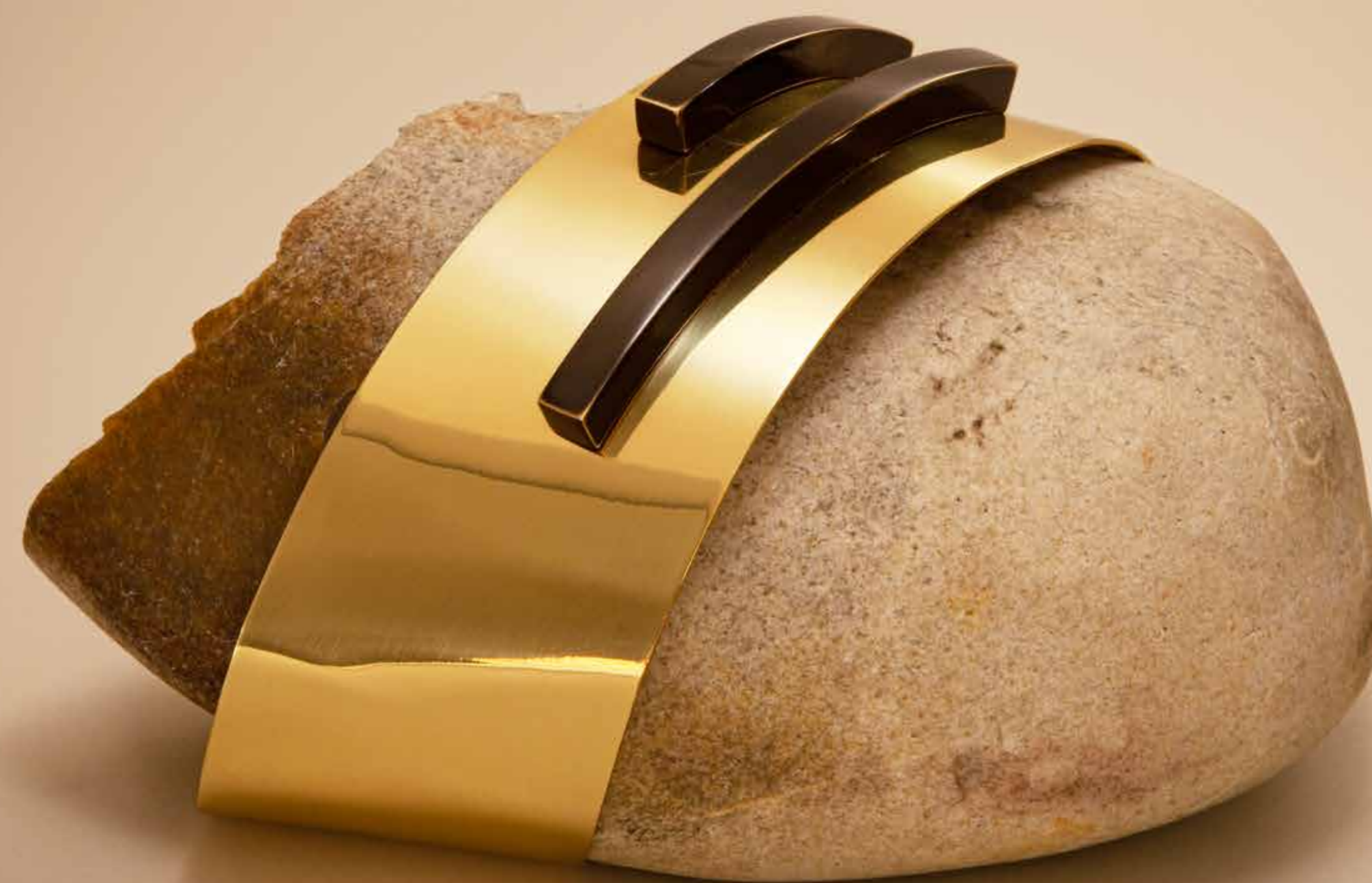
Envolvendo II, 2022

Pedra com latão polido e detalhe patinado • 12 x 17 x 15 cm