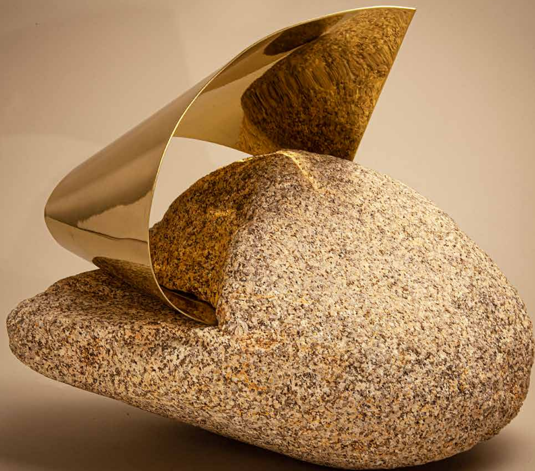
Proteção , 2022 • Pedra com fita de latão polido • 31,5 x 40 x 25,5 cm