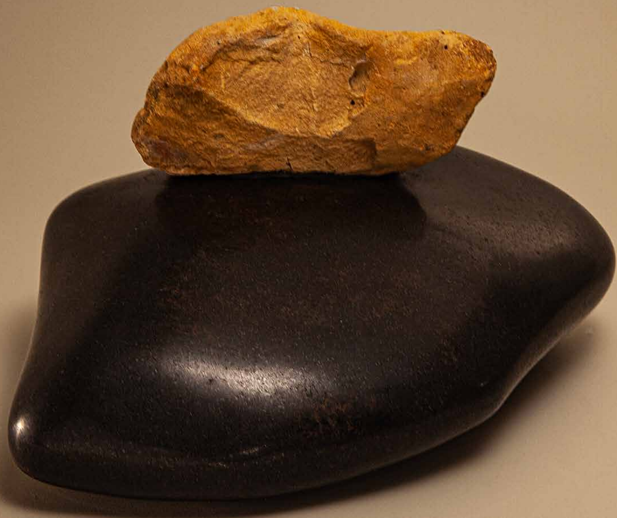
Convívio , 2022 • Pedra rústica e pedra polida • 16 x 25 x 23 cm