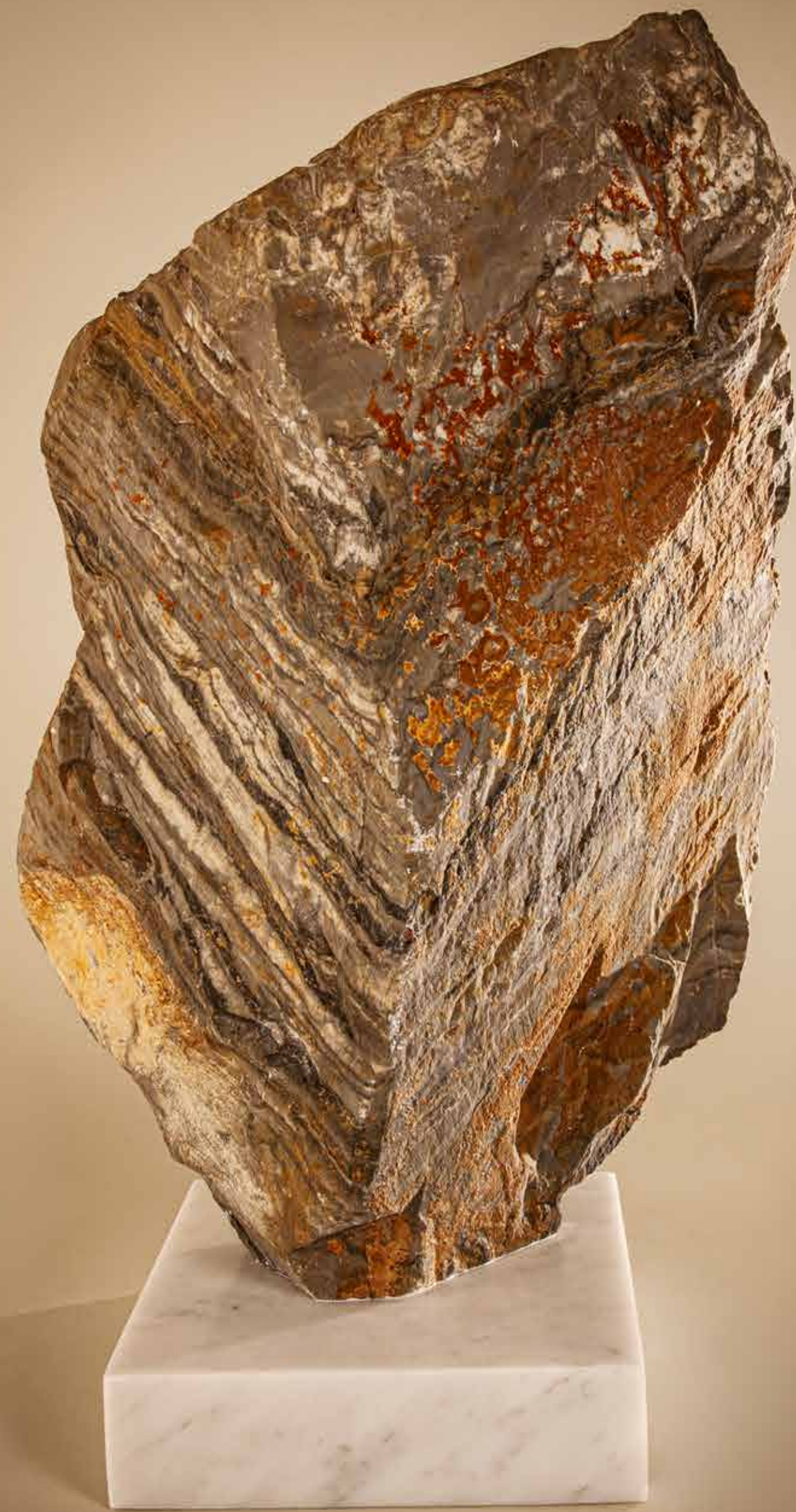
Monumento , 2022 • Pedra rústica sobre base em mármore carrara • 51,5 x 27,8 x 15,5 cm