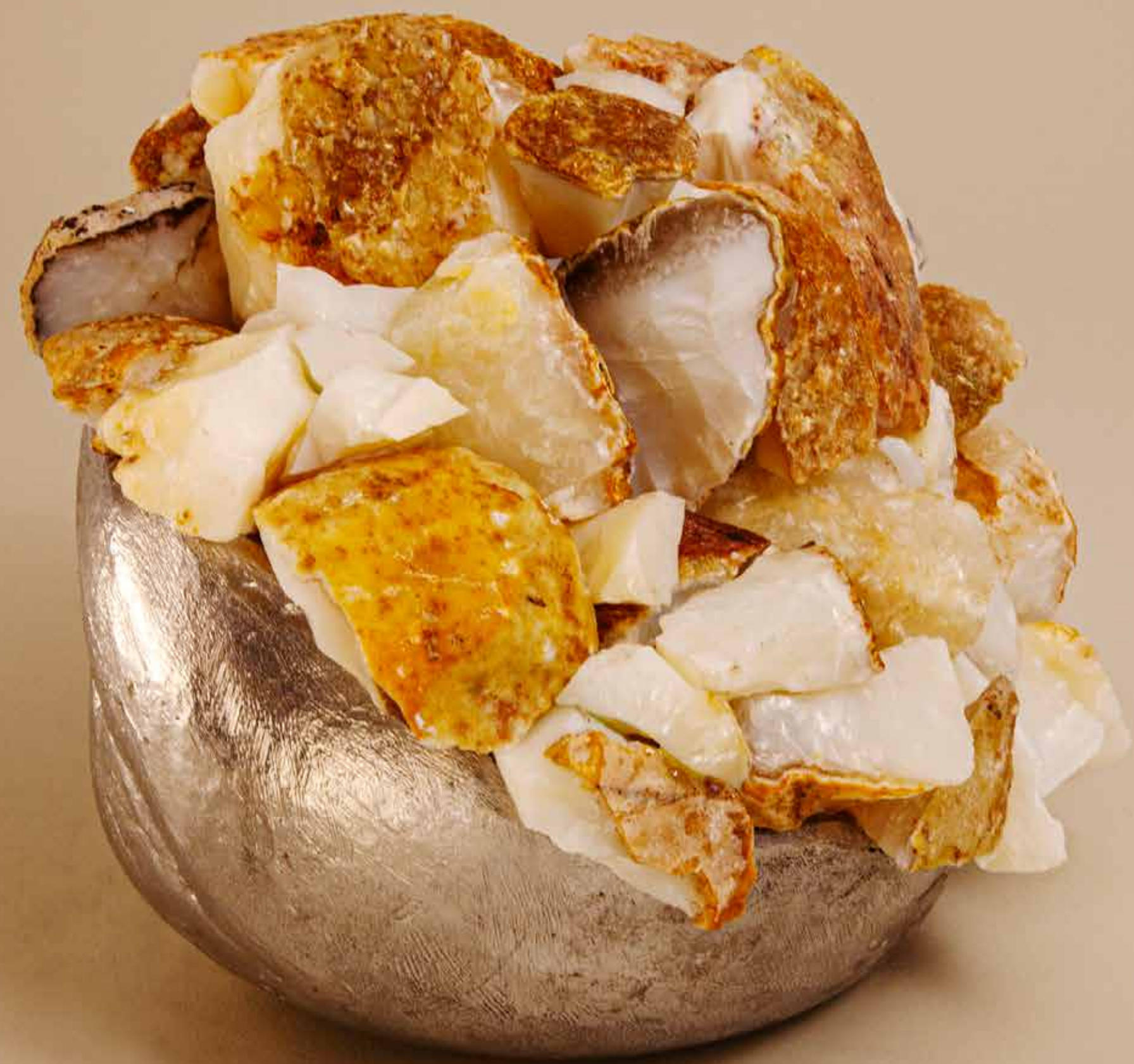
Docinho, 2022 • Conjunto de pedras sobre pedra com banho de alumínio • 14,5 x 18,5 x 17 cm

Pedra rústica sobre pedra com banho bronze • 12 x 31,5 x 21 cm