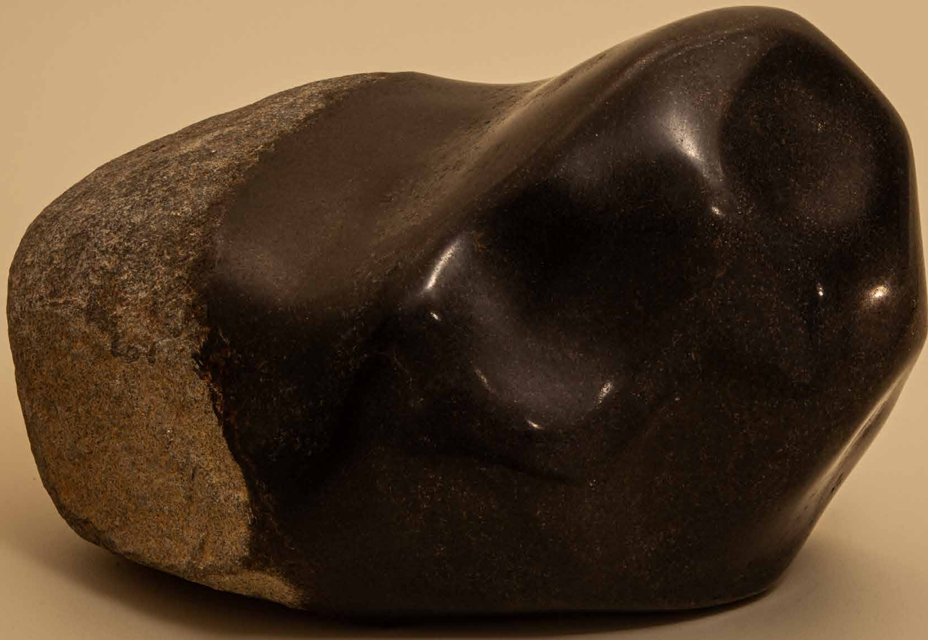
Revelação , 2022 • Pedra rústica com detalhe polido • 18,5 x 27 x 18,3 cm