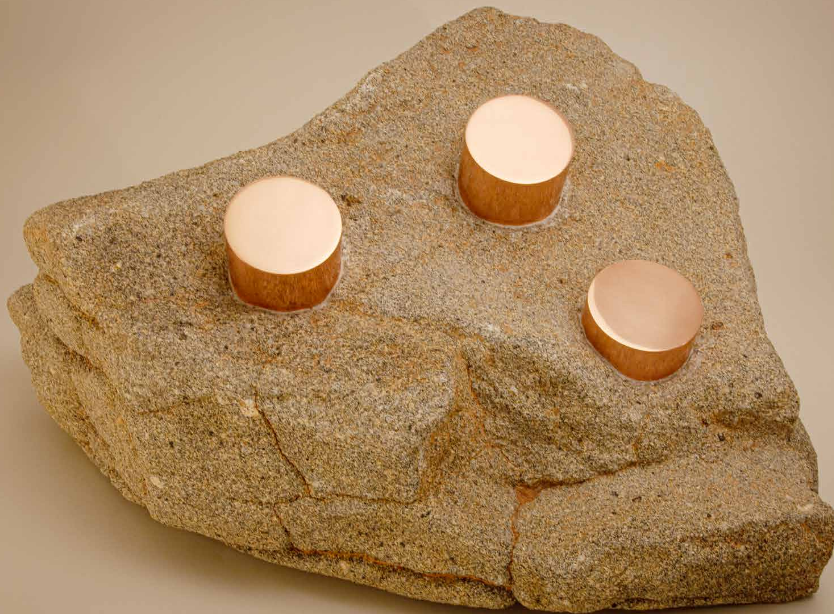
Conquista , 2022 • Pedra com detalhes em cobre • 26 x 60 x 33,5 cm