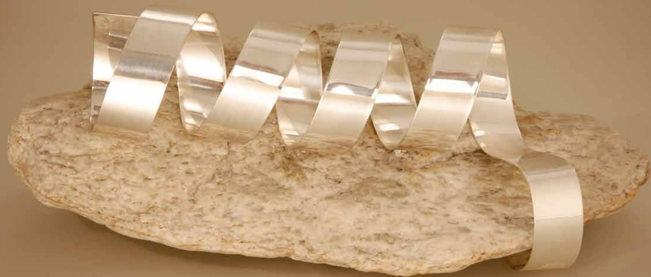
Saliente , 2022 • Pedra com fita de latão niquelado • 14,5 x 35,5 x 21,5 cm