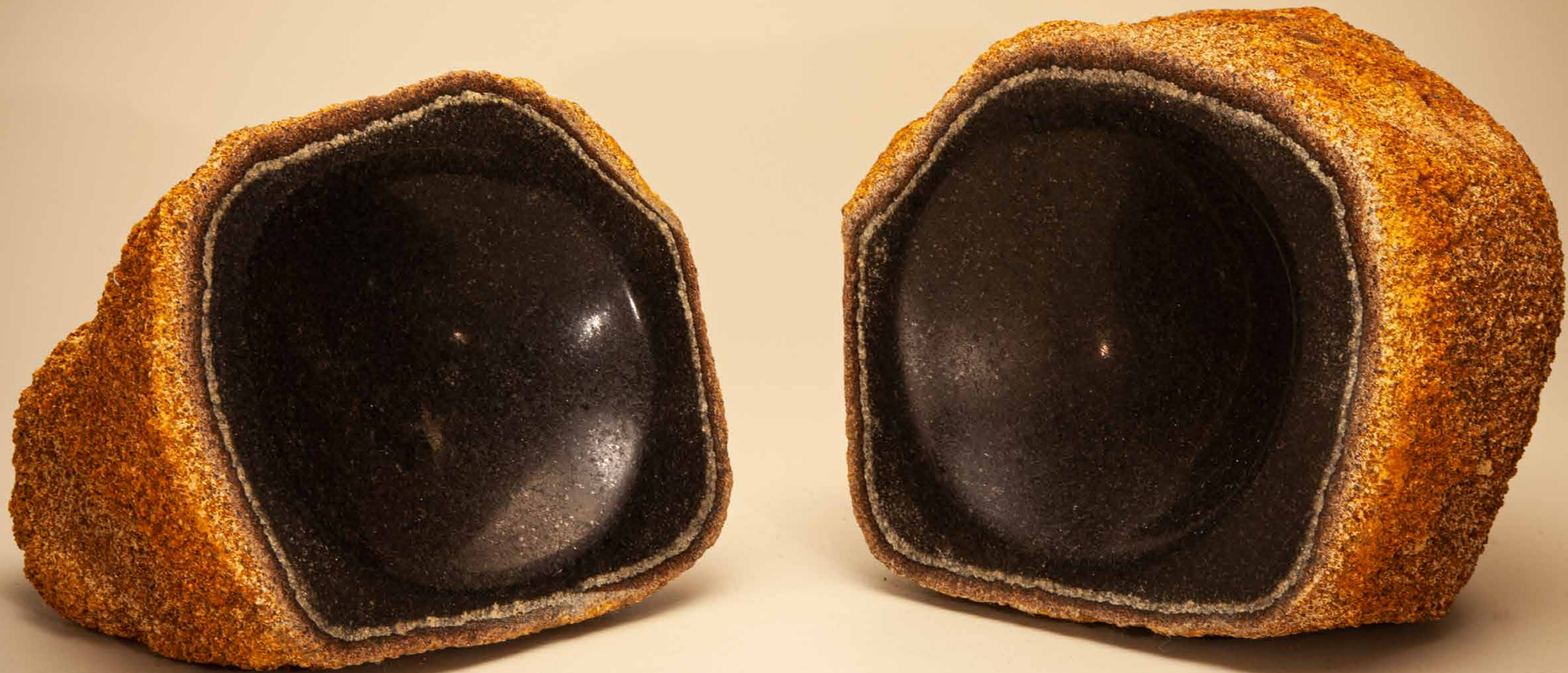
Beleza interior , 2022 • Pedra rústica com detalhe polido • 12,5 x 15 x 16 cm | 13,5 x 13,3 x 19 cm