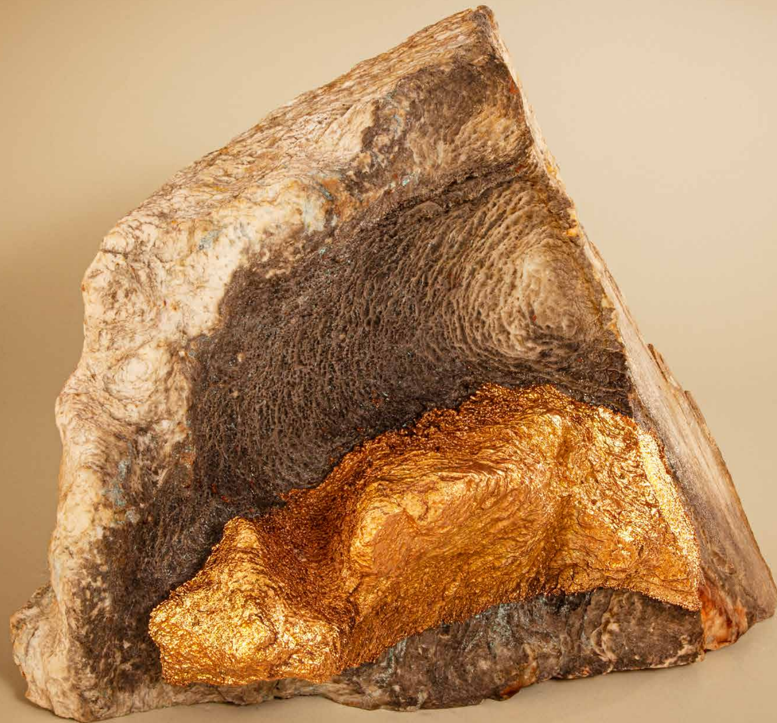
Ermita , 2022 • Pedra com detalhe em banho de cobre • 28 x 29,5 x 15 cm