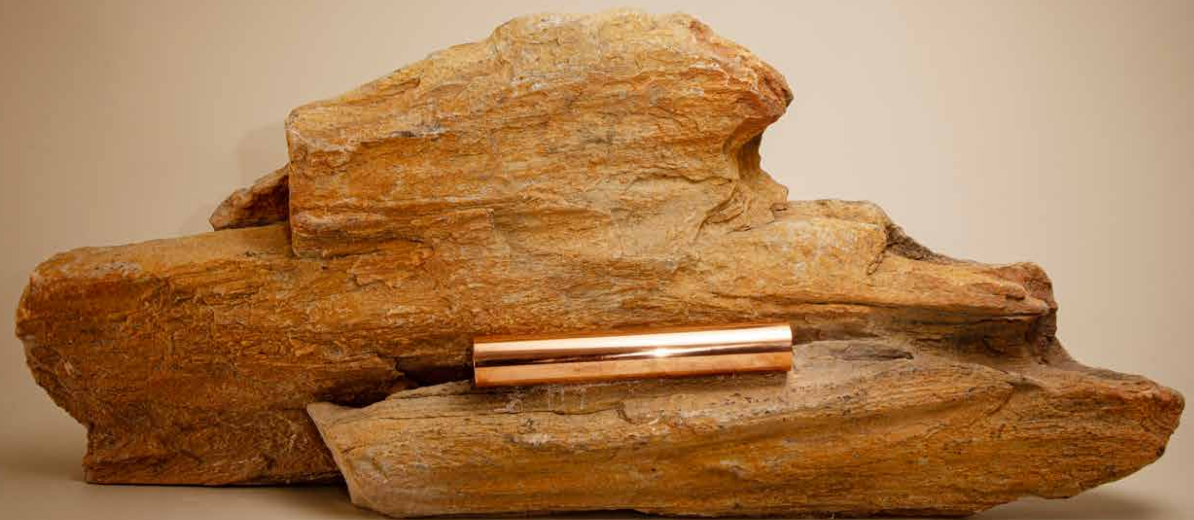
Desafio , 2022 • Pedra rústica com detalhes em cobre 30,5 x 73 x 15,5 cm